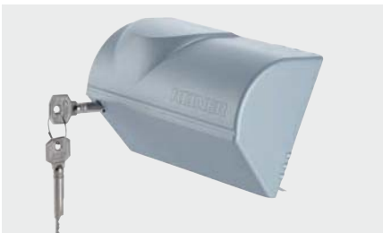
Gehäuseschloss, schützt vor Manipulationen an der Textplatte.